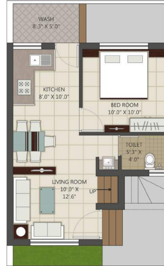
GROUND FLOOR PLAN B. AREA_ 432.66 Sq. FT.