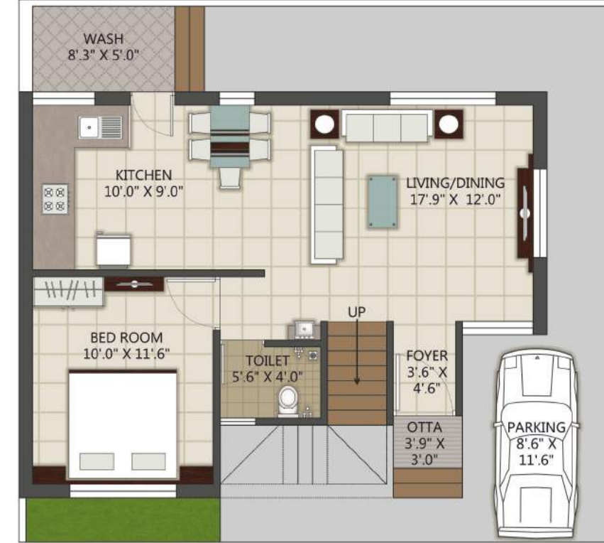
GROUND FLOOR PLAN B. AREA_ 569.31 Sq. FT.