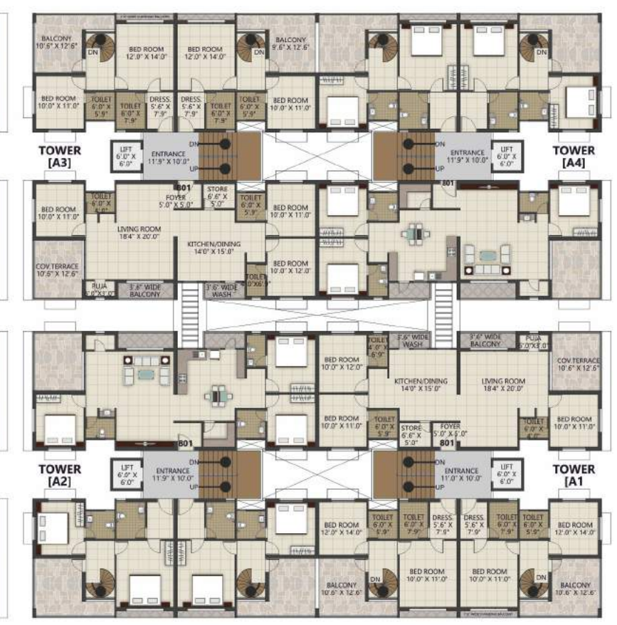
7th FLOOR PLAN