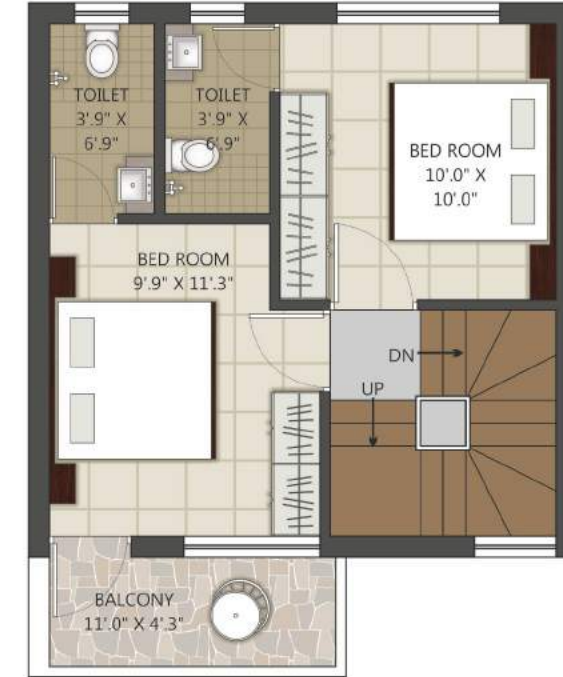
FIRST FLOOR PLAN B. AREA_ 432.66 Sq. FT.