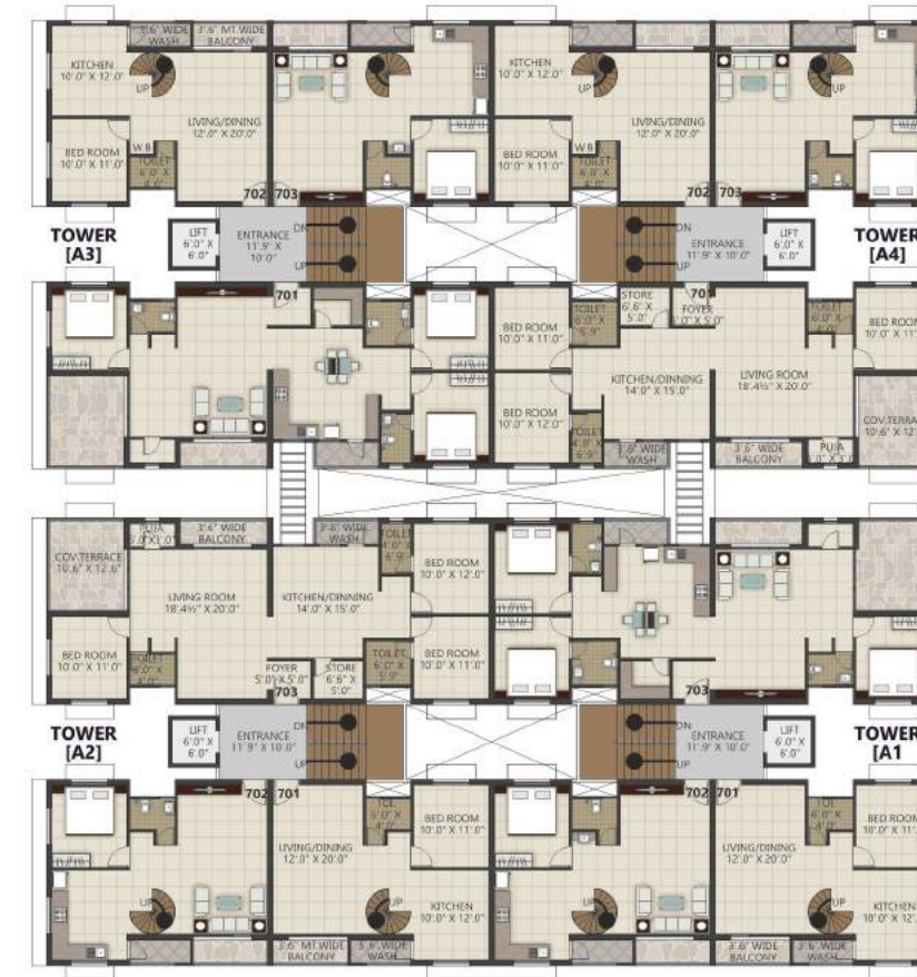
6th FLOOR PLAN