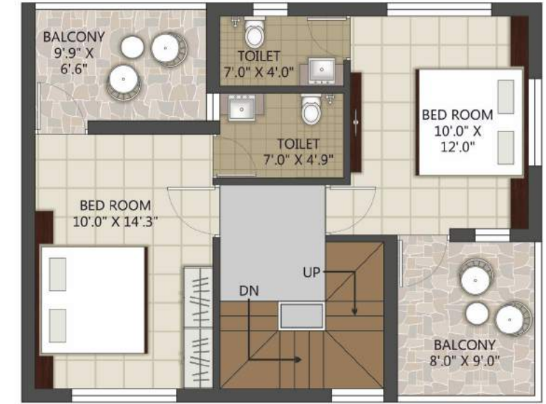
FIRST FLOOR PLAN B. AREA_ 648.61 Sq. FT.